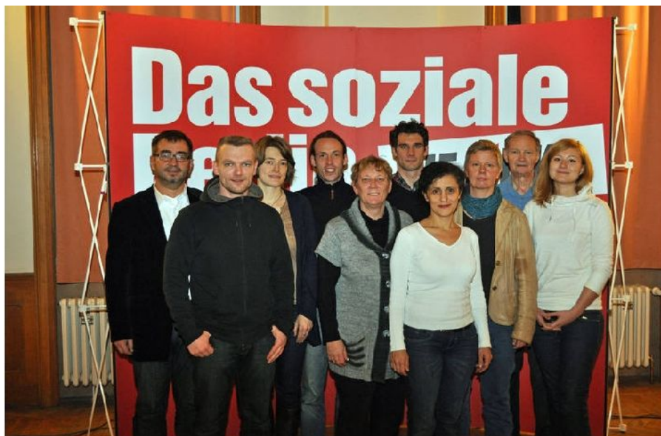
Der neue Vorstand der LINKEN im Bezirk Friedrichshain Kreuzberg

Welche Veränderungen sind mit dem neu gewählten Vorstand und euch als zwei gleichberechtigten Vorsitzenden zu erwarten?